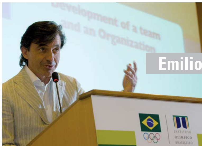
Emilio Sánchez Vicario, empresario y deportista, Vicepresidente de la FEM.

Emilio Sánchez Vicario (Madrid, 1965) es uno de los máximos exponentes del deporte. Su palmarés como tenista es impresionante, tanto en dobles como en individuales, donde llegó a ser número 1 del mundo. En el año 2005 fue nombrado Seleccionador y Capitán del equipo de Copa Davis por la Federación Española de Tenis, culminando esta etapa con la victoria contra Argentina en 2008, con la consecución de la tercera "ensaladera" de la historia del tenis español.